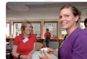
Avtäckningsmöte, alla adepter och mentorer Seminarium med middag och utdelning av deltagarbevis.