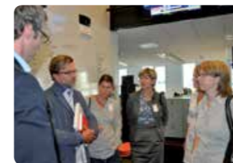
Seminarium med middag. Syftar till att skapa gemensamma förväntningar på programmet och föra in tankar och erfarenheter om mentorskap.